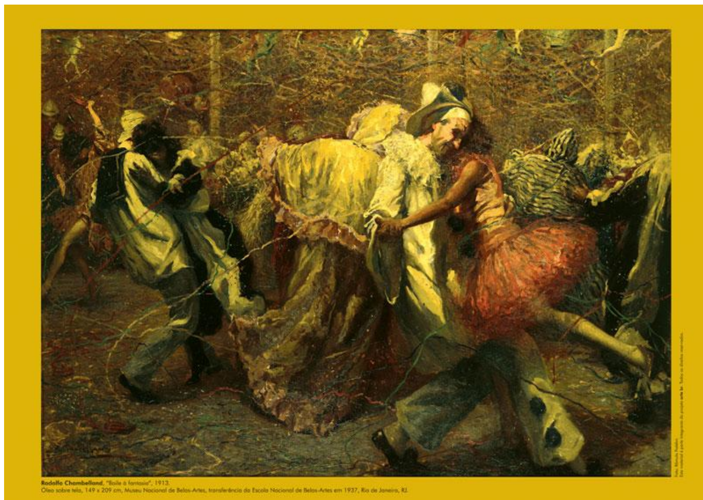
Pintura a óleo sobre tela de Rodolfo Chambelland, Baile à fantasia, de 1913, hoje no Museu Nacional de Belas Artes, Rio de Janeiro.