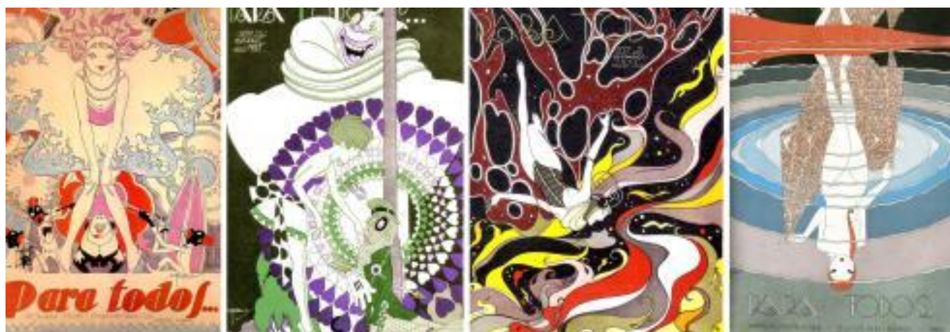
Carnaval ilustrado por J. Carlos