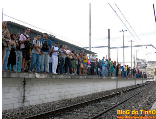
Passageiros aguardam o trem na plataforma da estação Duque de Caxias, pela manhã.